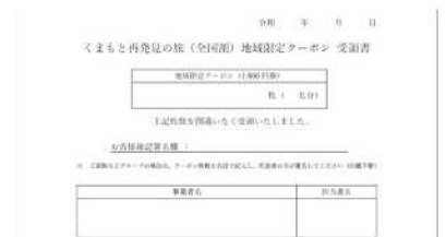
④ 地域限定クーポン受領書（旅行者用）