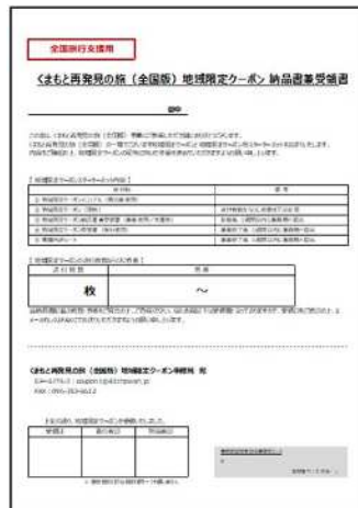
③ 地域限定クーポン納品書兼受領書