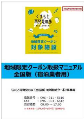
① 地域限定クーポンマニュアル（宿泊業者用）