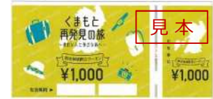
② 地域限定クーポン（現物）